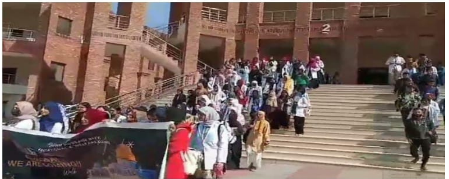
راولپنڈی میڈیکل یونیورسٹی میں الاقصی ہم آرہے ہیں مارچ