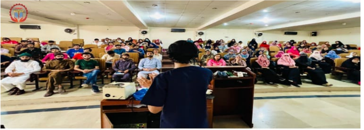
گجرانوالہ میڈیکل کالج میں میڈیکل ٹریننگ سیشن