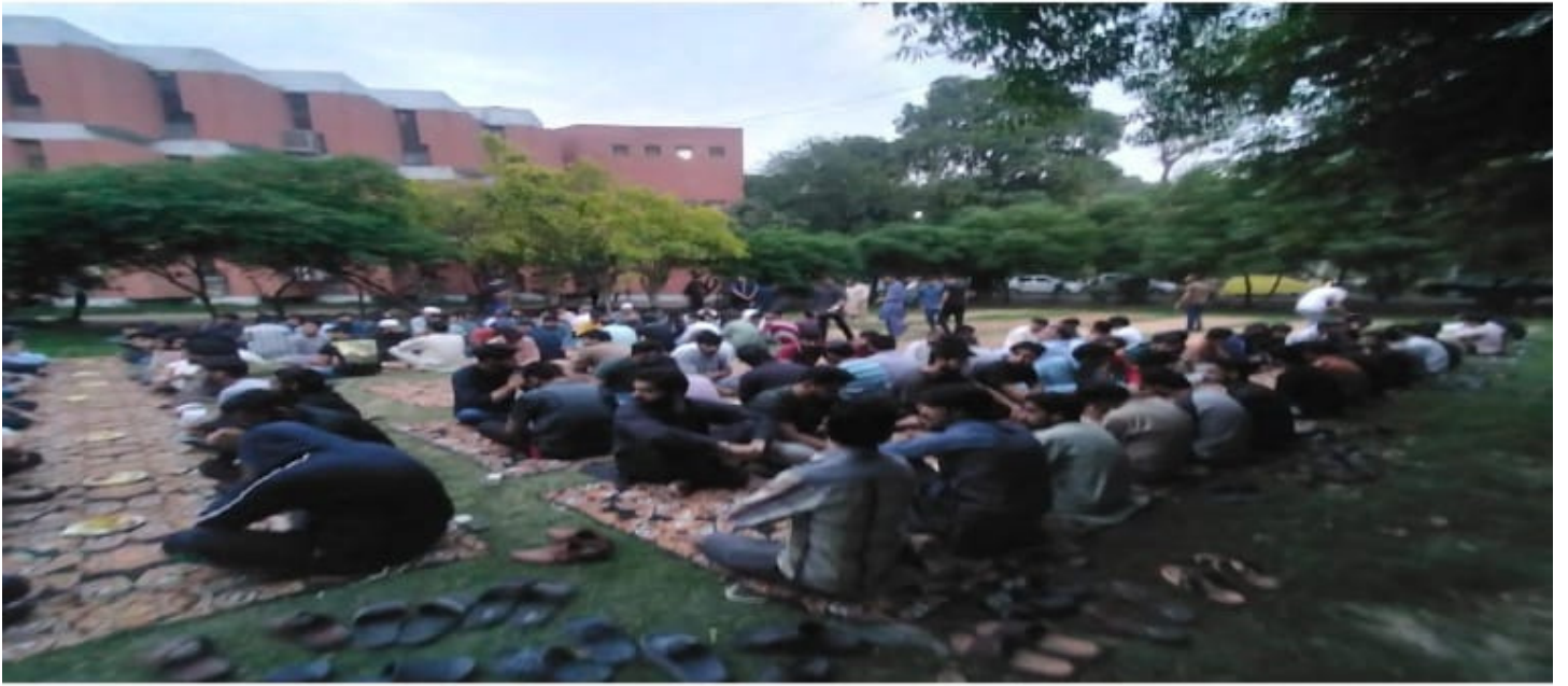
علامہ اقبال میڈیکل کالج لاہور سمیت 13 یونیورسٹیز/کالجز میں افطار دسترخوان