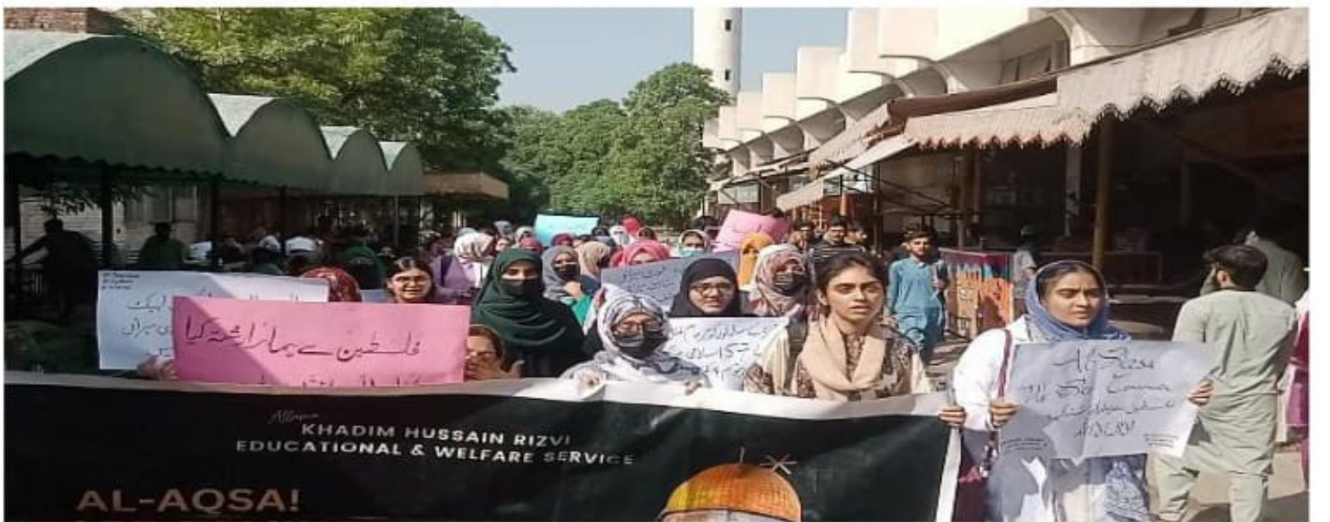
علامہ میڈیکل کالج لاہور میں الاقصی ہم آرہے ہیں مارچ