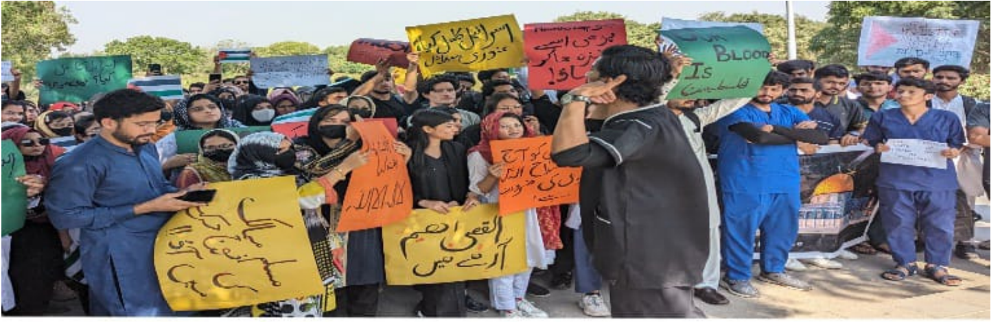
ہمدرد یونیورسٹی کراچی میں ڈاکٹرز، انجینئرز لیک الجہاد کے نعرے لگاتے ہوئے (الاقصی ہم آ رہے ہیں مارچ)