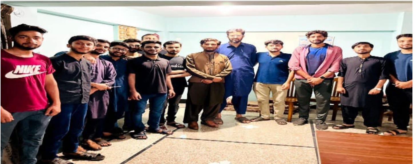
پونچھ میڈیکل کالج میں میڈیکل ٹریننگ سیشن