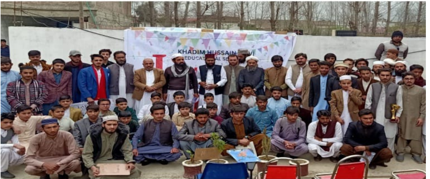
لیک ٹیلنٹ ٹیسٹ سوات