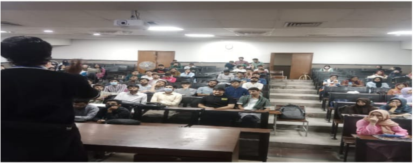
سروسز میڈیکل کالج لاہور میں الاقصی سیمینار