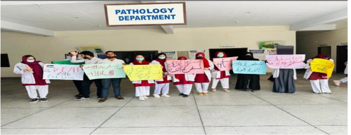
شاہدہ اسلام میڈیکل کالج میں الاقصی ہم آرہے ہیں مارچ