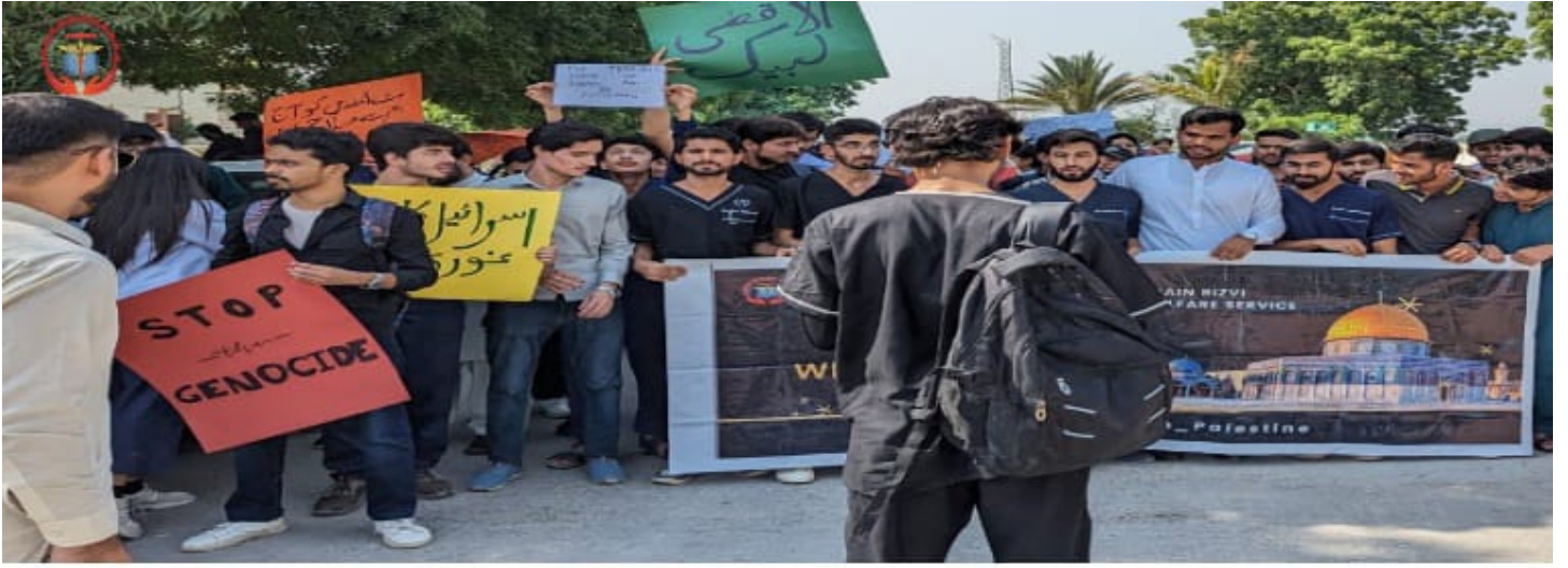
ہمدرد یونیورسٹی کراچی میں الاقصی ہم آرہے ہیں مارچ