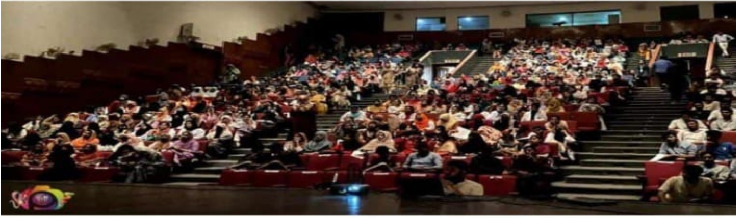
ملتان آڈیٹوریم میں خادم حسین رضوی میڈیکل سروس کی جانب سے فرسٹ ایڈ میڈیکل ورکشاپ