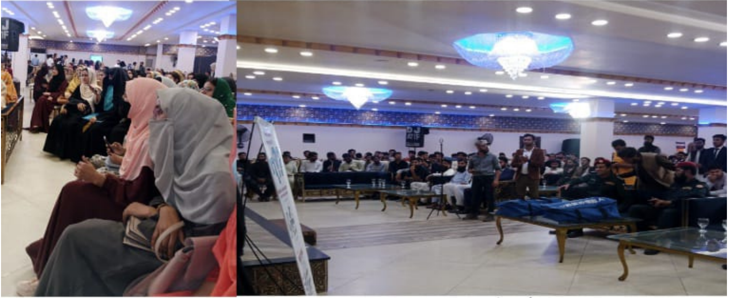
میڈیکو ٹیکنو ماسٹڈ کریسینڈو فیسٹیول لاہور