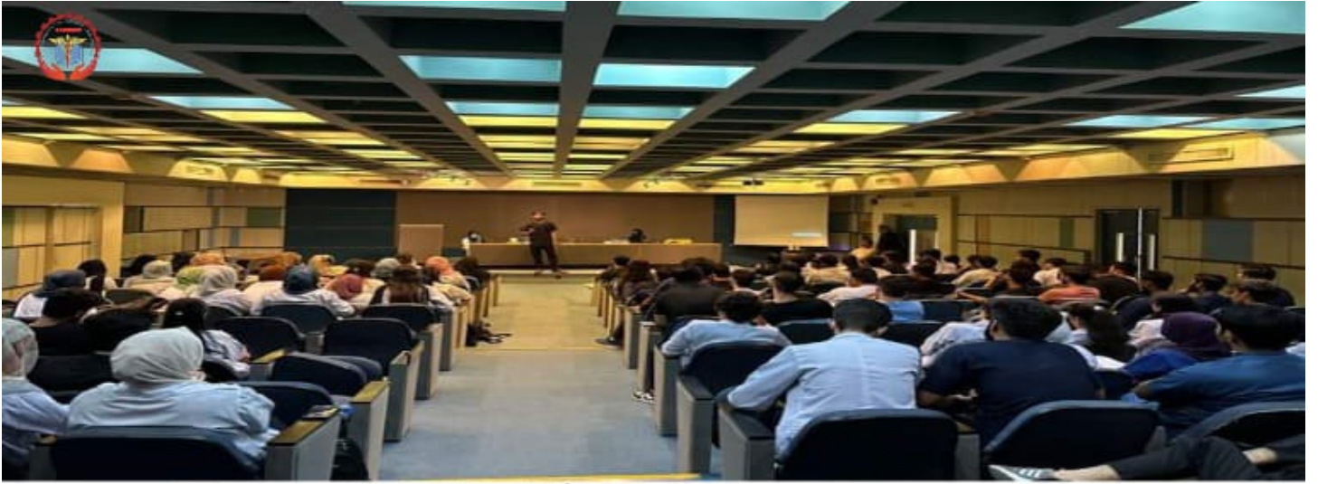
ہمدرد یونیورسٹی کراچی میں میڈیکل ٹریننگ سیشن (1)