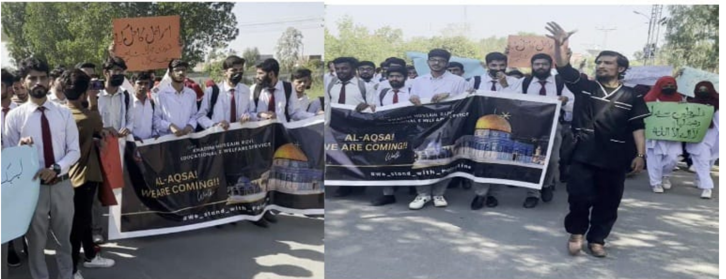
سرگودھا میڈیکل کالج میں الاقصی ہم آرہے ہیں مارچ