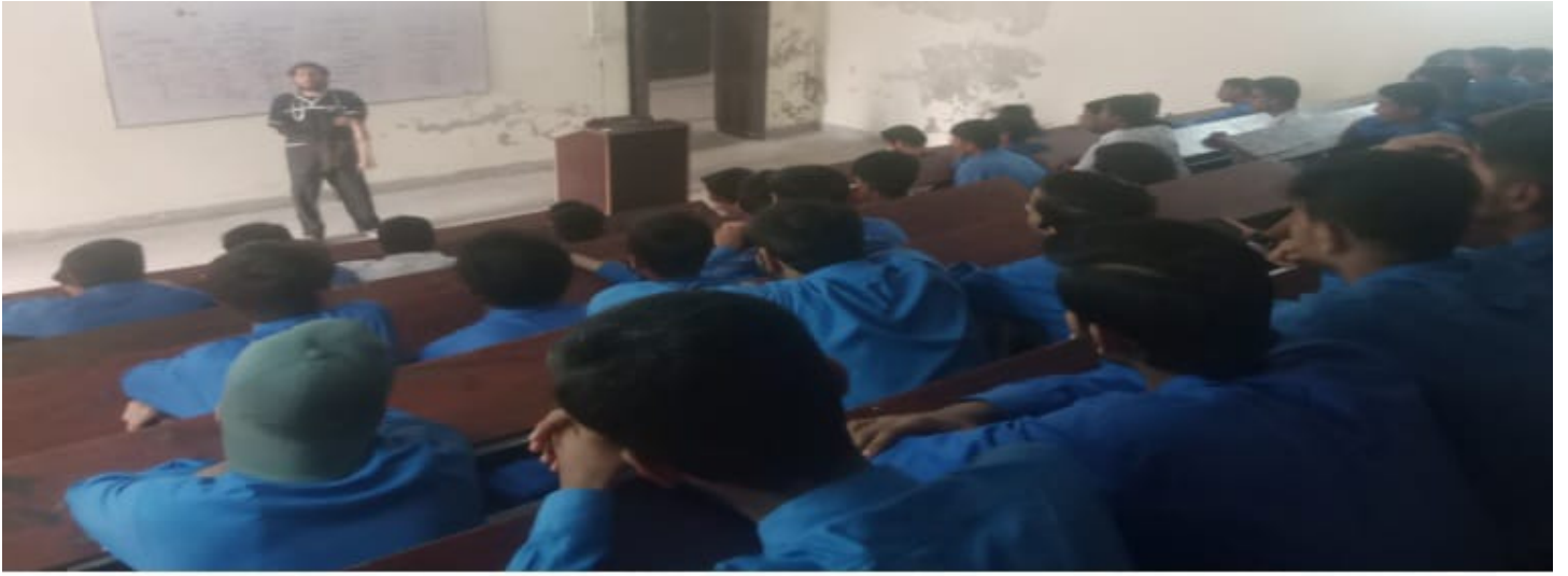
ایم اے او کالج میں میڈیکل ٹریننگ سیشن اور الاقصی سیمینار