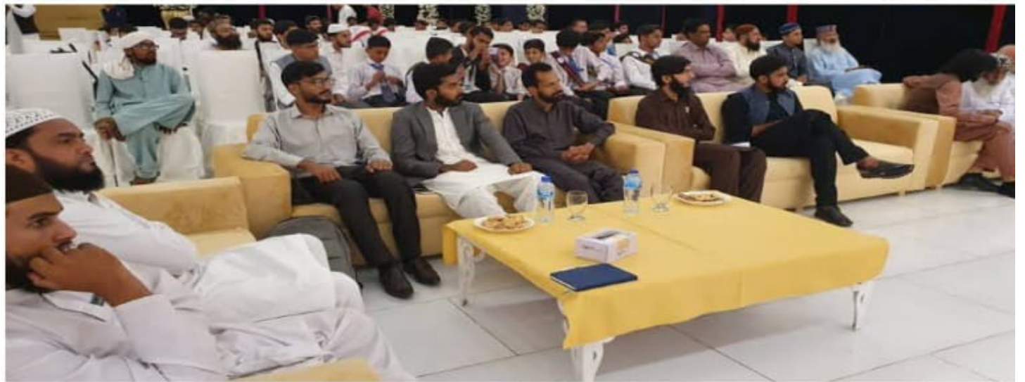
لیک سائنس فیسٹیول راولپنڈی