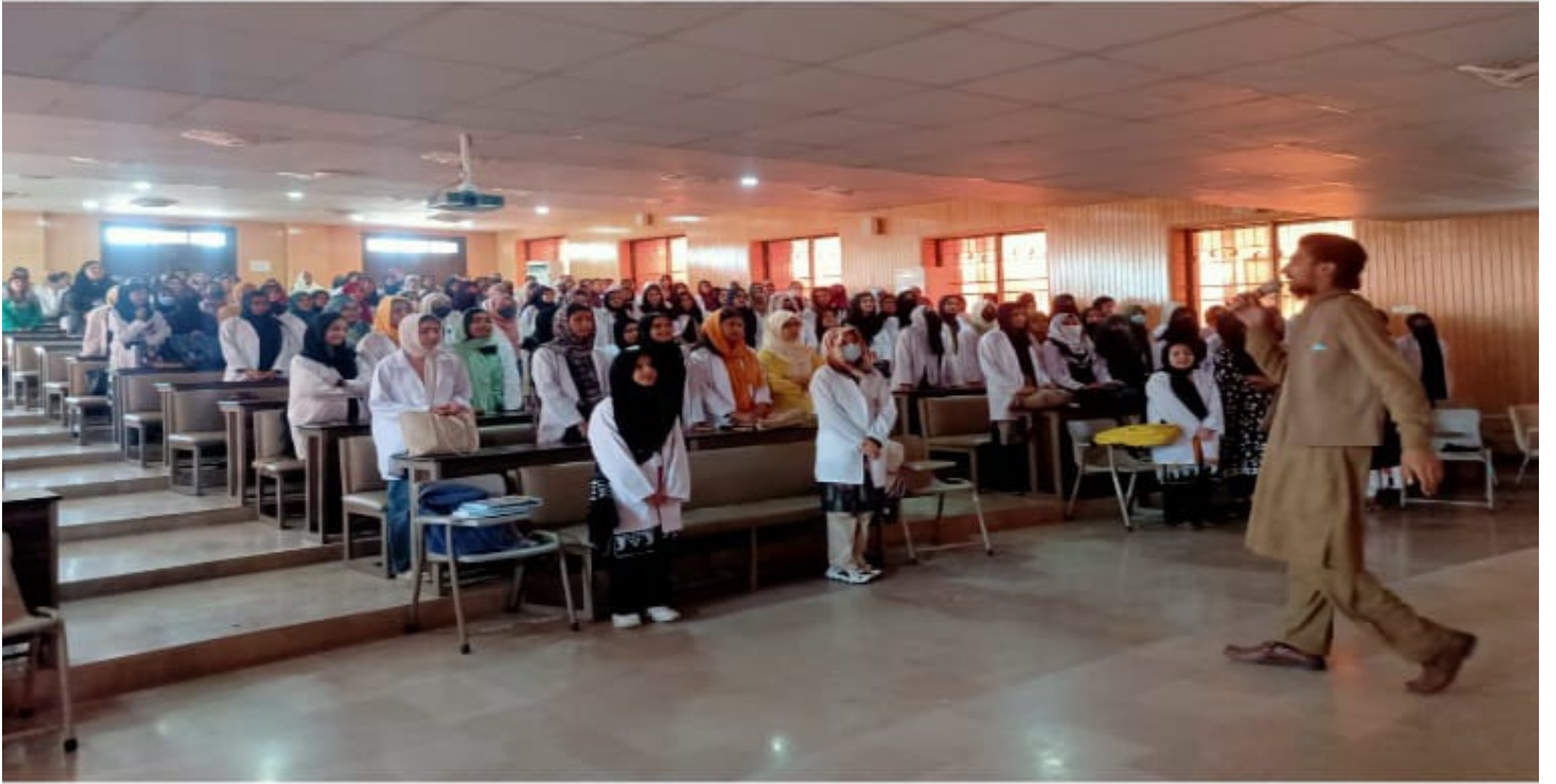
راولپنڈی میڈیکل یونیورسٹی میں الاقصیٰ سیمینار